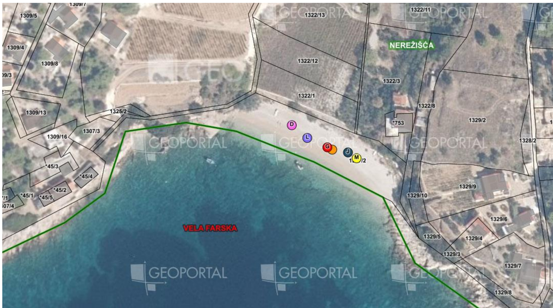
3. Uvala Vela Farska