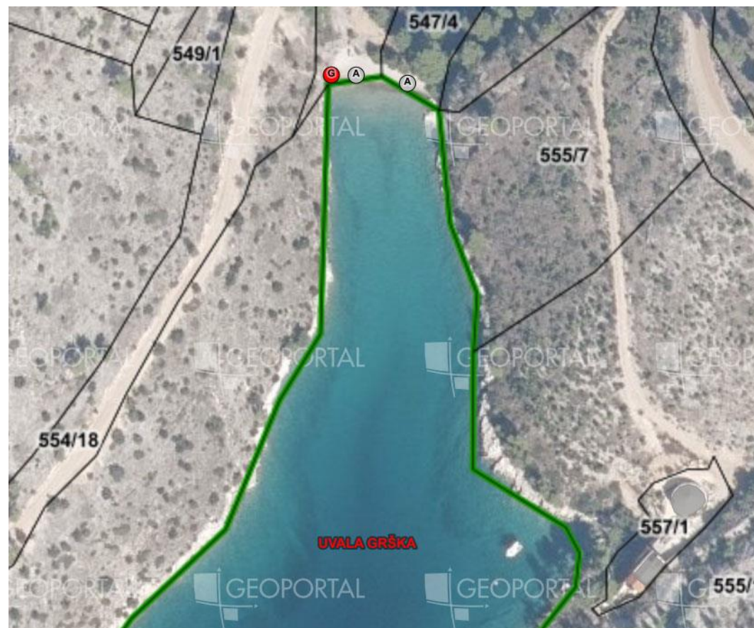
1. Uvala Grška