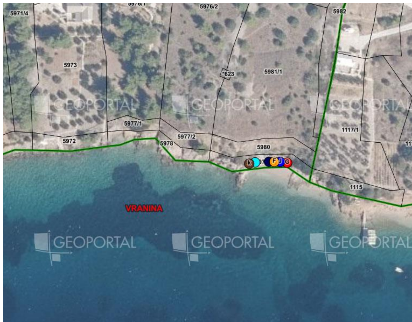
5. Uvala Vranina